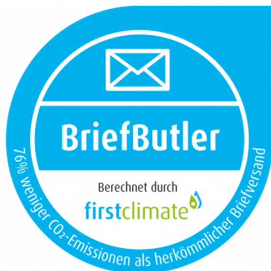
First Climate Label